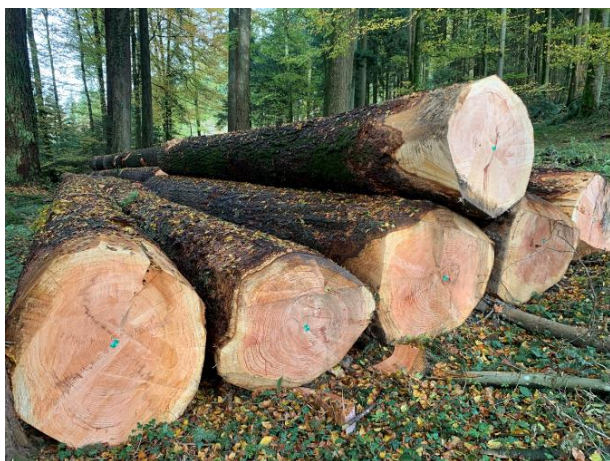
Mächtige Douglasien-Stämme aus dem Waldgebiet Baan, aus denen hochwertige Holzprodukte gefertigt werden.

Der Forstbetrieb Region Zofingen (FBRZ) pflegt und bewirtschaftet die Wälder der Ortsbürgergemeinden Rothrist, Strengelbach und Zofingen. Das Jahr 2023 war geprägt von neuen Wetterrekorden, einem Preisrückgang auf dem Holzmarkt, weiter steigender Nachfrage nach Holzenergie sowie finanziellen Sonderfaktoren.