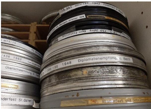
In einem Vorprojekt wurden die Scholl-Filme auf ihren Zustand untersucht.

Memoriav, die Fachstelle für audiovisuelles Kulturgut, begleitete das Projekt Scholl-Filme fachlich und unterstützte es finanziell.