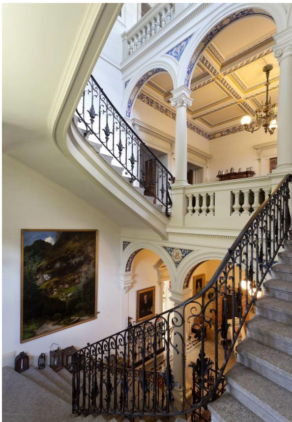
Der Museumsbau ahmt die Architektur von Florenz zur Zeit der Renaissance nach.