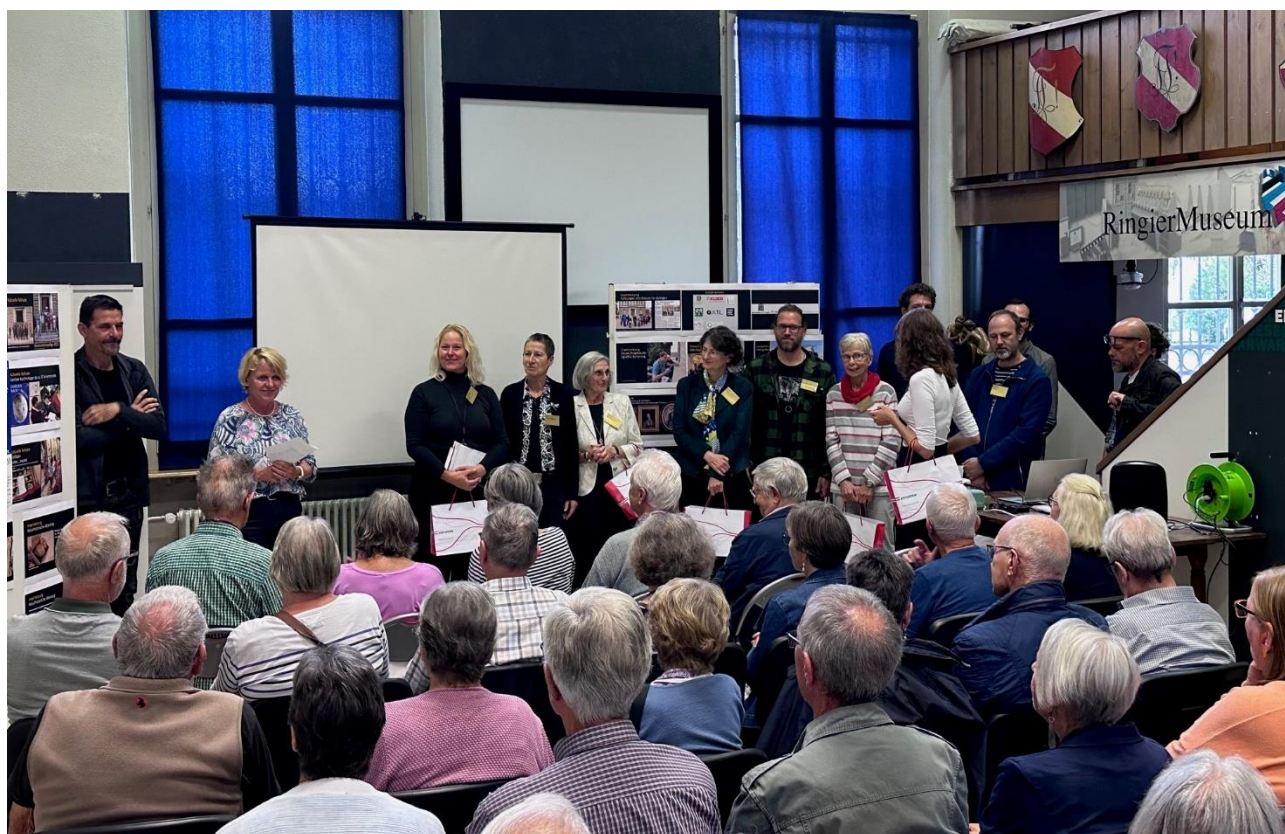
70 Personen nutzten die Gelegenheit für einen Blick hinter die Kulissen des Museums.

Das beliebte Ausschusssessen in der Munihubelhütte fand nicht statt, da dies nur noch einmal pro Amtsperiode durchgeführt wird.