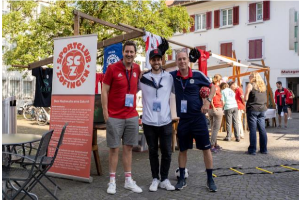
Vereins- und Informationsmarkt 2023

Freiwilliges Engagement von privaten Personen und Institutionen (z. B. Pro Senectute, Verein KISS [Nachbarschaftshilfe mit Zeiterfassung], Walkinggruppen, usw.) sind nach Möglichkeit im Sinne des Vereinswesens miteinzubeziehen (z. B. Vereins- und Informationsmarkt), zu schätzen und zu ehren.