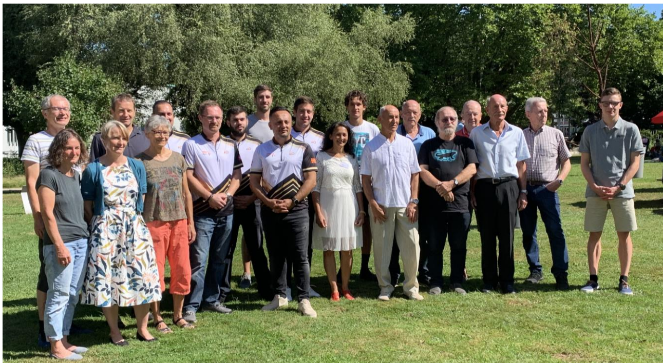
Sportlerinnen- und Sportlerehrung 2022

Zofingen organisiert jährlich eine Sportlerinnen- und Sportlerehrung, bei der Sportlerinnen und Sportler mit ausserordentlich gut erbrachten Leistungen geehrt werden. Der Ehrung zu Grunde liegt ein eigenes Sportlerinnen- und Sportlerehrungskonzept 17 .