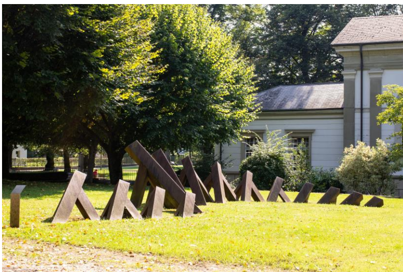
Freie Fläche im Rosengarten, welche gerne für Yoga-Trainings genutzt wird.