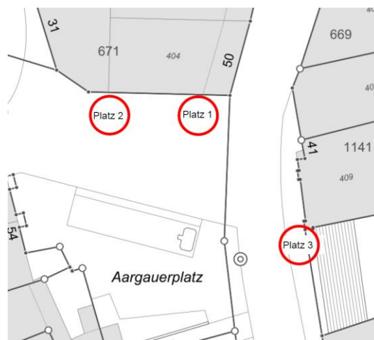
drei weitere Alternativen auf dem Aargauerplatz ohne Marktstände der Stadt

Das Merkblatt «Veranstaltungen Merkblatt Standaktionen» ist integraler Bestandteil bei Durchführung einer Standaktion in Zofingen. Die Veranstalterin / der Veranstalter bestätigt mit der Einreichung des Meldeformulars, das Merkblatt gelesen und verstanden zu haben sowie die darin enthaltenen Auflagen zu befolgen.