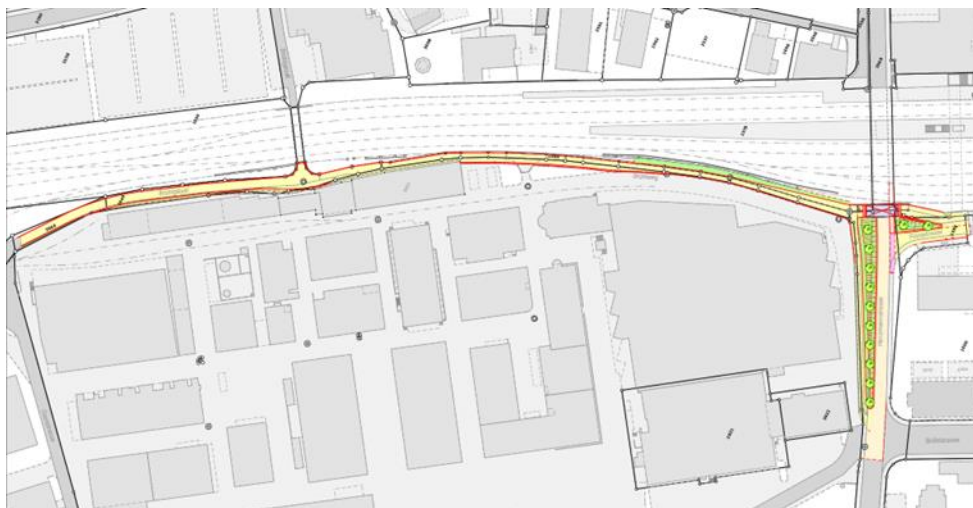
Bild 4: Übersichtsplan, Firma Siegfried AG, Parzelle 1 676, Brühlweg und Martinsweg