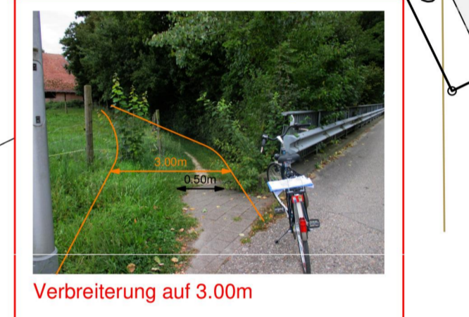
Wigger-Radweg zwischen Stengelbacherbrücke und Aeschwuh