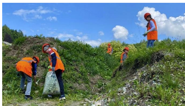
Die Klassen S1a und R1a bekämpften unter fachkundiger Anleitung die Neophyten auf dem Häfligerareal.

Der schulische Beitrag hat sich bislang als effizient erwiesen. Bei Bedarf können über die Schule Schüleraktionen organisiert werden.