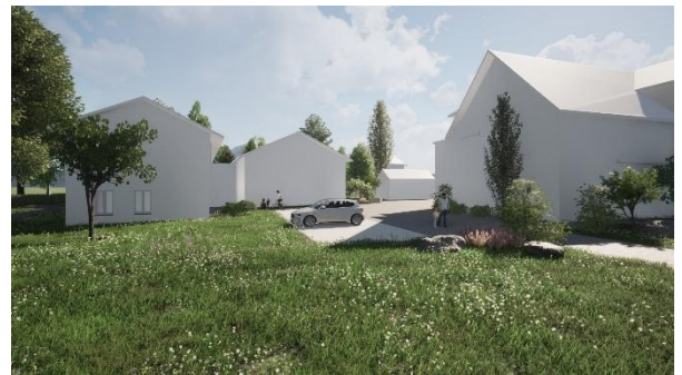
Visualisierung des geplanten Erweiterungsbaus (Bildmitte) der Musikschule

Das Vorprojekt ist erstellt. Der Stadtrat hat das Geschäft zum Baukredit vor der Beratung im Einwohnerrat zurückgezogen, da zuerst übergeordnete Fragen zur Schulraumplanung beantwortet werden sollen.