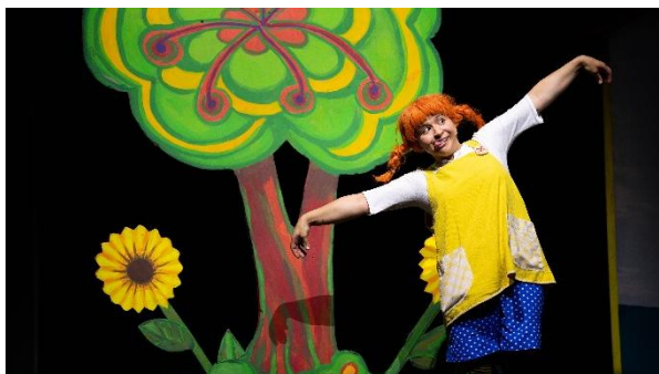
Im beliebten Kindermusical feierte Pippi Geburtstag.

Beim Kindermusical von Musik & Theater Zofingen wurden aufgrund hoher Nachfrage erstmals zwei Vorstellungen angeboten. Und in der Stadtbibliothek können sich die Kinder neu in eine kleine Holzhütte zurückziehen und Hörspielen lauschen.