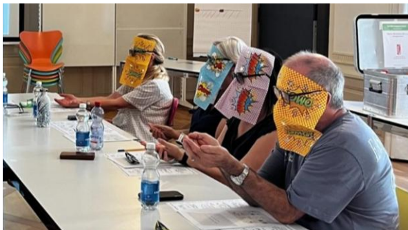
Workshop Ernährungsparcours: Übung, um bewusst wahrzunehmen, was man isst

Alle geplanten Kampagnen wurden mit Workshops, "Game Changer"-Fachinputs und begleitender Kommunikation im Intranet umgesetzt. Im September wurde eine Gesamtevaluation zu allen Angeboten durchgeführt. Der Rücklauf war bescheiden, die Feedbacks jedoch gut. Die Antworten dienen als Standortbestimmung für die Ausarbeitung der Schwerpunktthemen und Angebote 2026.