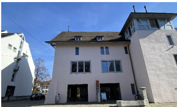
Die Lerninsel befindet sich an der Hinteren Hauptgasse 3.

Die Lerninsel an der Hinteren Hauptgasse hat sich als geeigneter Lernort für Schülerinnen und Schüler etabliert, die aus besonderen Gründen, wie zum Beispiel aufgrund einer Autismus-Spektrum-Störung oder eines ausgeprägten AD(H)S, vorübergehend oder längerfristig eine Auszeit vom Unterricht in der Regelklasse brauchen. Mittlerweile werden drei Klassen bzw. Kleingruppen geführt, jeweils eine pro Zyklus.