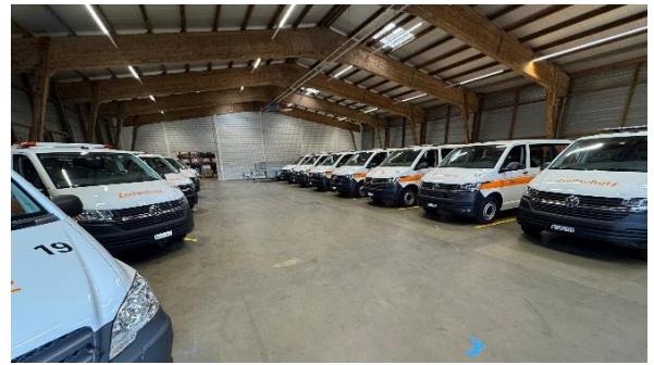
Fahrzeughalle im Logistikstandort der ZSO

Der Logistikstandort wurde im ordentlichen Dienstbetrieb der ZSO Region Zofingen eingesetzt. Verbesserungen werden laufend umgesetzt. Der Logistikstandort ist bei den Partnern und den Milizangehörigen der ZSO bekannt. Die Einsatzbereitschaft ist jederzeit gegeben.