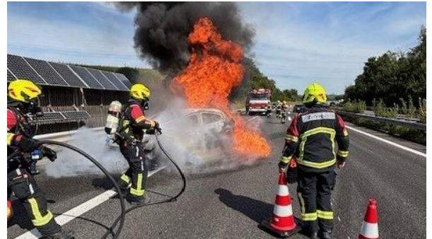
Fahrzeugbrand auf der Autobahn A1