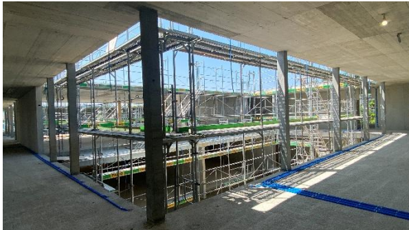
Die Innenhöfe des neuen Schulhauses OSZ A werden fassbar.

Das Projekt ist bezüglich des Terminplans und der Kosten gut auf Kurs.