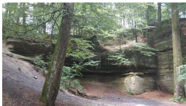
Geologisches Objekt Chutzenhöfli

Der Stadtrat hat das Natur- und Landschaftsinventar im Dezember 2025 in einer Zwischenversion zur Kenntnis genommen und wird es im Verlauf des Jahres 2026 genehmigen.