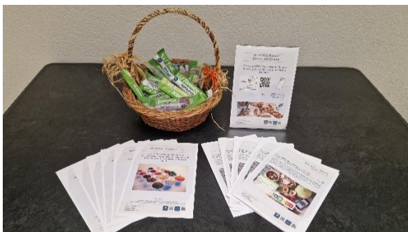
Informativer "Game Changer" zum Thema Ernährung im Pausenraum