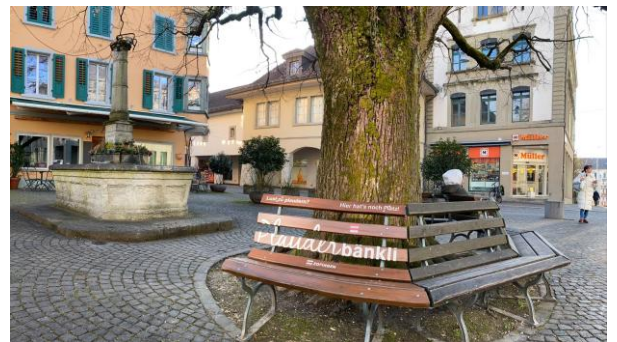
"Plauderbänkli" auf dem Alten Postplatz

Mitte Mai konnten drei "Plauderbänkli" eingeweiht werden: auf dem Chorplatz und dem Alten Postplatz sowie beim Rosengarten. Ziel der "Plauderbänkli" ist es, Menschen aller Altersgruppen miteinander ins Gespräch zu bringen und so den sozialen Austausch zu fördern.