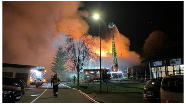
Gebäudebrand in Richenthal: Unterstützung mit der Autodrehleiter im Nachbarkanton Luzern

Die aufgebauten Organisationen wurden in mehreren Ernstfalleinsätzen (Brände und Elementarereignisse) gefordert und überregional eingesetzt. Von der Alarmierung über den Einsatz bis hin zur Wiederherstellung der Einsatzbereitschaft verlief alles reibungslos. Das Regionale Führungsorgan (RFO) wurde zweimal durch die Katastrophenvorsorge des Kantons Aargau beübt. Beide Übungen wurden erfolgreich bestanden.