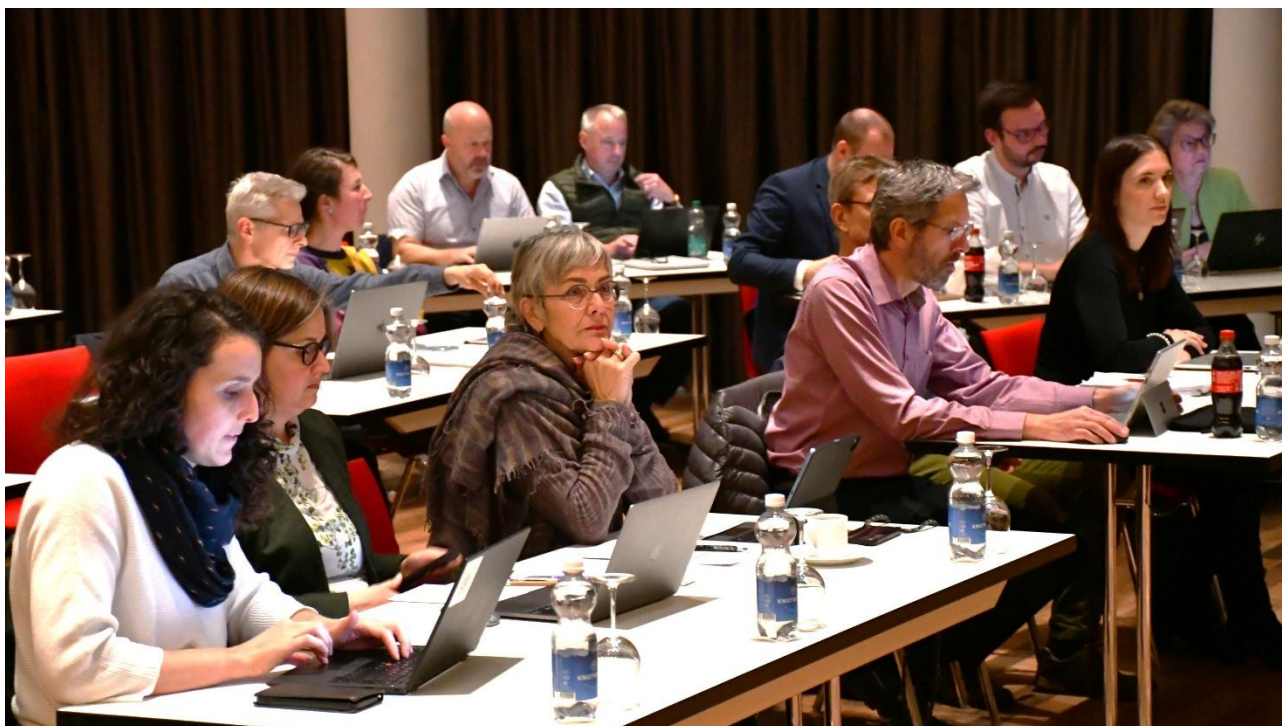
Der Einwohnerrat an der Budget-Sitzung vom 25. November 2025