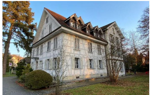
Das Hauptgebäude der Friedau

Das Gebäude wird nach wie vor von Geflüchteten aus der Ukraine genutzt. Zuerst muss diesbezüglich eine Alternative gefunden werden.