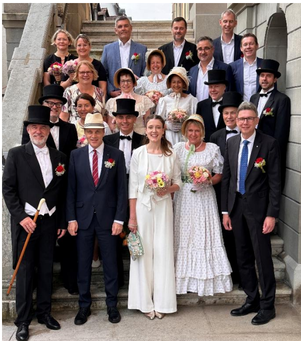
Der Zofinger Stadtrat empfing seine Gäste am Kinderfest in historischer Kleidung.

Am 4. Juli feierte die Stadt 200 Jahre Kinderfest – ein Freudentag unter dem Motto "damals und heute". Die Altstadt wurde zur festlichen Bühne. Rund 1600 Kinder und ihre Begleitung zogen blumengeschmückt durch die Gassen der Altstadt.