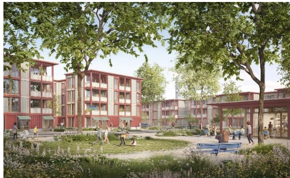
Siegerprojekt "Chaturaji" für die Bebauung der Unteren Vorstadt

In der Unteren Vorstadt soll mit rund 90 Wohnungen und einem kleinen öffentlichen Park am Tor zur Altstadt ein neues Stadtquartier entstehen. Im November 2025 hat der Einwohnerrat dem Baurecht für die Wohnbaugenossenschaft DOMUM zugestimmt.