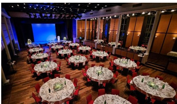
Stadtsaal Zofingen: Bankett im grossen Saal

Im November 2025 hat der Stadtrat die Strategie für den Stadtsaal genehmigt. Die Einwohnerratsvorlage für das überarbeitete Stadtsaalreglement wird 2026 erarbeitet und dem Einwohnerrat vorgelegt.