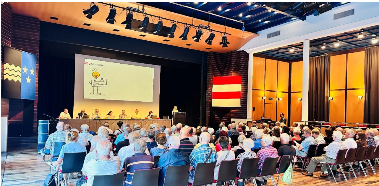
Gemeindeversammlung vom 19. Juni 2025

Im vorliegenden Jahresbericht informiert der Stadtrat über die wichtigsten Ereignisse und die Tätigkeit der Behörden, Verwaltung und Betriebe der Ortsbürgergemeinde Zofingen im Jahr 2025. Die Jahresrechnung 2025 ist in einem separaten Dokument enthalten.