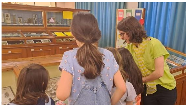
Schulklasse im Museum Zofingen

Der Museumsbetrieb hat sich positiv entwickelt. Mit fast 40 Besuchen von Schulklassen aller Stufen, vom Kindergarten bis zur Kantonsschule Zofingen, erfüllte das Museum einen wichtigen Beitrag als externer Lernort der Region. Insgesamt wurden drei neue Schulangebote entwickelt. Sie werden vom Kanton Aargau durch "Kultur macht Schule" anerkannt. "Kultur macht Schule" prüft jeweils, ob die Workshops und Führungen des Museums dem Qualitätsstandard für Schulangebote entsprechen.