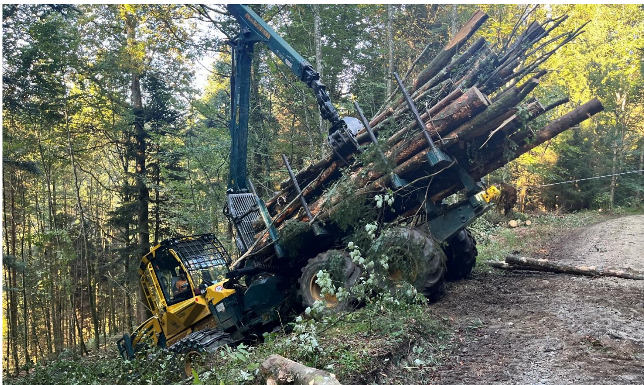
Für eine Durchforstung im steilen Gelände im Waldgebiet Baan (Kantonsgebiet Luzern) wurden Forstmaschinen mit Traktionswinden eingesetzt. Dies ermöglicht eine bodenschonende Holzernte.

Jahresdurchschnitt leicht über der Referenzperiode und grosse Sturmereignisse blieben glücklicherweise aus. Entsprechend tief waren Schäden an den Waldbeständen und die damit verbundenen Zwangsnutzungen. Die warmen und oft nassen Wintermonate stellten die mechanisch unterstützte Waldbewirtschaftung wiederum vor grosse Herausforderungen. Viel Sachverstand, Erfahrungen aus den letzten Jahren, eine rollende Planung und grosse Flexibilität aller Akteure waren gefragt. So konnten die für die Holzernte unerlässlichen Forstmaschinen eingesetzt werden, ohne unverantwortliche Schäden am Waldboden zu verursachen.