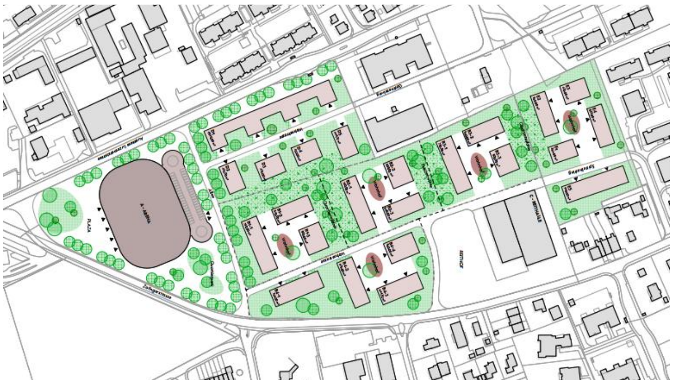
Situationsplan eines möglichen Projekts für eine Arena mit kombinierter Wohn- und Gewerbenutzung (Visualisierung: ffbk Architekten AG)

Auch unabhängig von dieser Projektidee besteht die Möglichkeit einer Umzonung in eine Wohn- und Gewerbezone. Eine damit verbundene allfällige Sanierung der Deponie muss in diese Prozesse einbezogen werden.