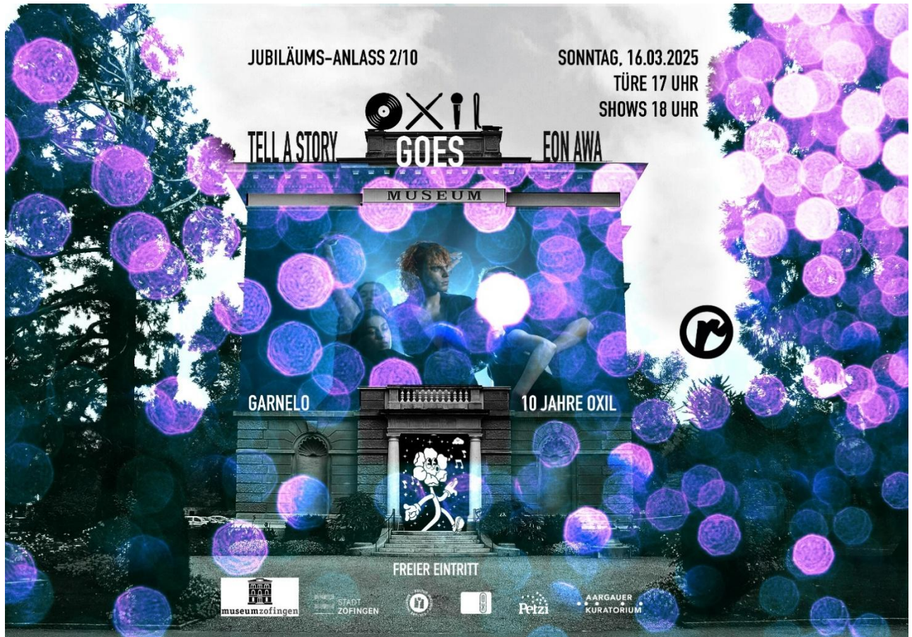
Das Museum wird zur Bühne – 10 Jahre OXIL zu Gast am 16. März 2025.

Ein anderes Publikum hat der Kooperationsanlass mit dem OXIL angezogen. Die gelungene Adaption des fiorentinischen Palazzos als Kulisse für Tanz und Musik zeigt den Museumsbau als architektonisches Juwel.