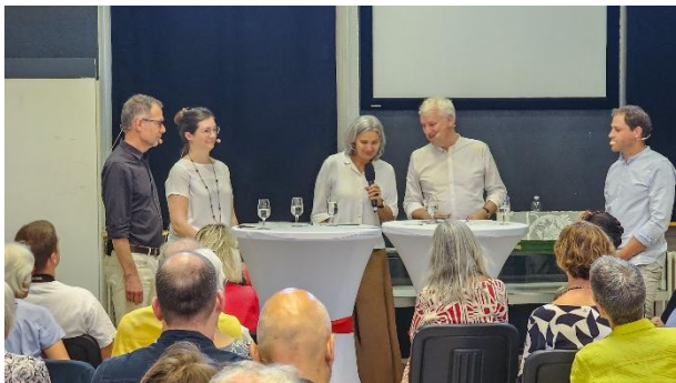
Grosse Freude beim Podium an der Vernissage des Kunstführers.

Ein Highlight für das Museum war auch die Vernissage des Schweizerischen Kunstführers Nr. 1140, "Das Museum Zofingen" im Juni. Der Verlag "Gesellschaft für Schweizerische Kunstgeschichte" ehrt den vom Architekten Emil Vogt errichteten Museumsbau. Die Architekturgeschichte des Gebäudes wird von der Kunsthistorikerin und Denkmalpflegerin Franziska Schmid-Schärer damit nachhaltig festgehalten. Ihre öffentlichen Führungen über das Museumsgebäude vermitteln dem Publikum anschaulich den Wert dieses einzigartigen Baus.