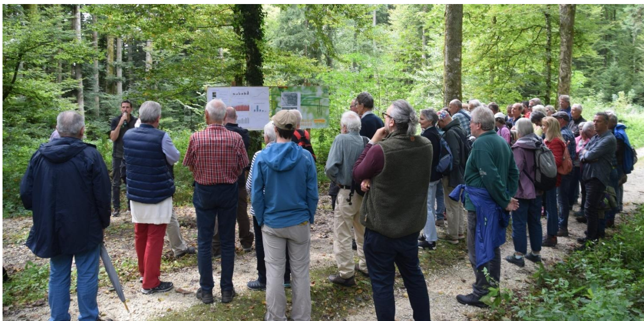
An einem Posten wurde der neue Betriebsplan 2025–2039 des Forstbetriebs Region Zofingen vorgestellt.

Dank tatkräftiger Mitwirkung des Forstbetriebs Region Zofingen und des Werkhofs konnte am 13. September 2025 der beliebte Ortsbürgerwaldgang durchgeführt werden. Dieser führte entlang einer Route mit vier Posten durch den Baanwald. Anschliessend erwartete die zahlreichen Teilnehmenden ein Schlusshock mit "Zobig" beim Forstwerkhof Baan.