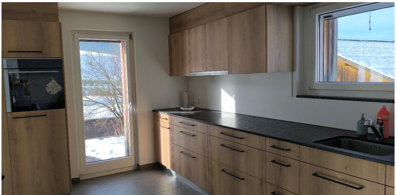
Blick in die renovierte Küche des Pächterhofs im Riedtal

Zur Optimierung des Betriebs plant der Pächter, das marode Fahrsilo durch Hochsilos zu ersetzen. Aus diesem Grund wurde Ende Jahr ein Baugesuch eingereicht. Der Ersatz betrifft die Baurechtsfläche und erfolgt auf Kosten und Risiko des Pächters.