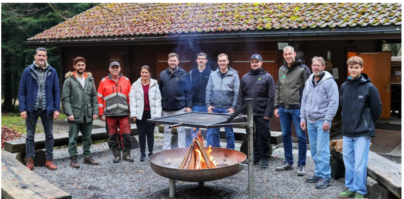
Das "neue" FBRZ-Team vor dem Waldhaus Munihubel im Waldgebiet Baan

Weitere Informationen: Der vollständige Geschäftsbericht 2025 des FBRZ ist unter www.fb-regionzofingen.ch abrufbar.